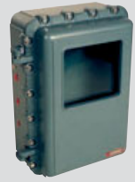
EJB 241 M1